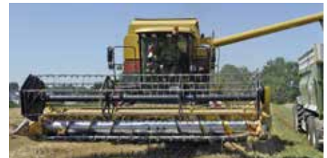
Mechanische Sicherung des Schneidwerks: