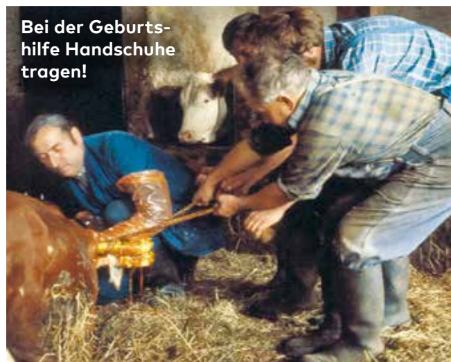
Bei der Geburtshilfe Handschuhe tragen!

Es kann aber auch ohne wesentliche Beschwerden zu einem Befall innerer Organe kommen, welcher dann langfristig zu Schäden führt. Ein Beispiel ist die Ausbildung von Fuchsbandwurmzysten in der menschlichen Leber. Diese sind aber eher selten.