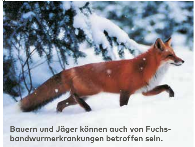
Bauern und Jäger können auch von Fuchsbandwurmerkrankungen betroffen sein.