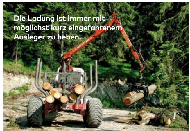
Die Ladung ist immer mit möglichst kurz eingefahrenem Ausleger zu heben.