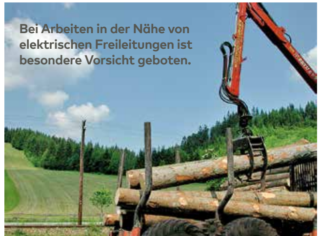
Bei Arbeiten in der Nähe von elektrischen Freileitungen ist besondere Vorsicht geboten.