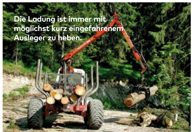
Die Ladung ist immer mit möglichst kurz eingefahrenem Ausleger zu heben.