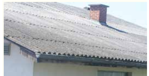
Vorsicht beim Abtragen alter Dächer!

Asbest wurde bis 1990 in vielfältiger Form verbaut, seither ist die Verwendung verboten. Asbestfasern können eingeatmet Asbestose (Bindegewebs- oder Narbenbildung in der Lunge) oder aber auch Krebserkrankungen (Lunge, Rippenfell, Herzbeutel, Bauchfell, Kehlkopf und vermutlich Eierstöcke) auslösen. Folglich ist bei Abbruch-, Sanierungs- oder Instandhaltungsarbeiten beispielsweise beim Umgang mit alten Eternitplatten, Rohrleitungen und Brandschutzmaterial (z.B. Ofendichtungen) besondere Vorsicht geboten. Aber auch alte Böden, Farbanstriche, Kupplungs- und Bremsbeläge können asbesthaltig sein. Das Material ist so schonend wie möglich zu behandeln , da sonst eventuell Fasern in größeren Mengen in die Luft gelangen können. Niemals dürfen alte Eternitdachplatten mit dem Winkelschleifer geschnitten oder einfach in den Container geworfen werden! Zudem ist Schutzausrüstung konsequent zu verwenden ( mind. Feinstaubmaske FFP2 , Einwegschutzanzug, Handschuhe) und das Material sorgsam und richtig zu entsorgen.