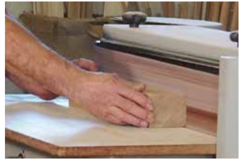
Bei Schleifarbeiten entsteht besonders feiner Staub.

Bestimmte Holzstäube können Tumore im Bereich der Nase und des Rachens hervorrufen. In Anhang V der Grenzwerteverordnung 2021 ist eine Auflistung aller eindeutig krebserzeugend eingestuft Holzarten zu finden. Darunter fallen beispielsweise Ahorn, Birke, Buche, Eiche, Erle, Esche, Kastanie, Kirsche, Linde, Pappel, Platane, Ulme, Walnuss, Weide, Weißbuche, Afrikanisches Mahagoni, Balsa, Brasilianisches Rosenholz, Ebenholz, Palisander und Teak. Alle anderen Holzstäube sind als vermutlich krebserzeugend eingestuft.