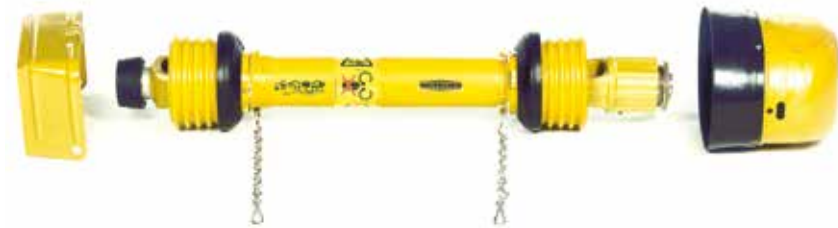
Schutzschild am Traktor

Oft ist es nur ein kurzer Augenblick der Unachtsamkeit, der zu gefährlichen Unfällen führen kann. Vor allem kleinere Kinder verstehen noch nicht, wie Maschinen und Fahrzeuge funktionieren und können deshalb die Unfallgefahren nicht richtig einschätzen. Spielerisch versuchen sie, Erwachsene bei der Arbeit nachzuahmen und setzen so womöglich gefährliche Maschinen mit einem einzigen Handgriff in Gang. Eine möglichst genaue Erklärung der Sachverhalte ist besonders für mithelfende Jugendliche wichtig. Auf die gesetzliche Aufsichtspflicht ist besonders hinzuweisen und speziell zu achten. Dadurch soll vermieden werden, dass sie sich durch Selbstüberschätzung und Unkenntnis in Gefahr bringen. Diese Gefahren lassen sich größtenteils vermeiden, wenn gewisse Vorsichtsmaßnahmen eingehalten werden.