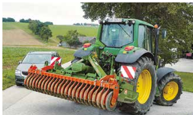
Anbaugeräte scheren bei Kurvenfahrt aus.