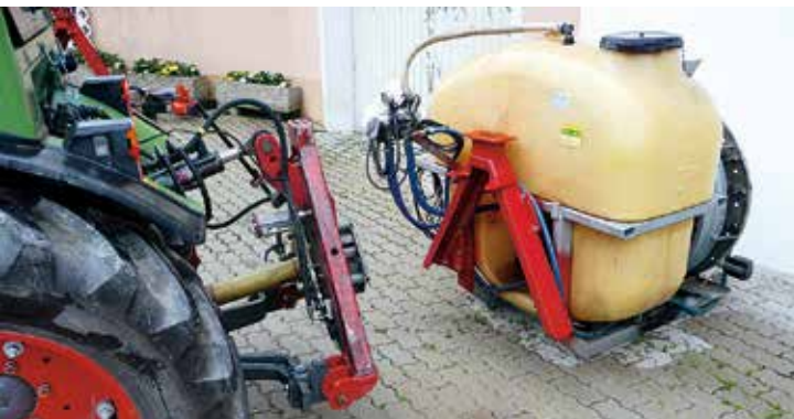
Einphasenkuppler (Anbaudreieck): Damit ist ein automatisches An- und Abkuppeln der Gelenkwelle und Hydraulikanschlüsse möglich.