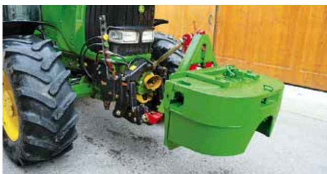
Ballastgewichte anbringen; zulässige Achsbelastung beachten.