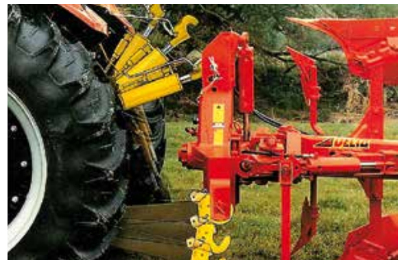
Zweiphasenkuppler: Fanghaken auf Unter- und Oberlenker